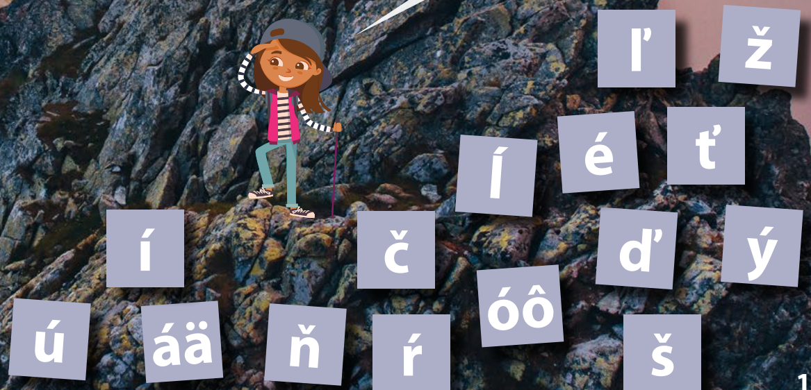
Photo: High Tatras, Slovak Republic