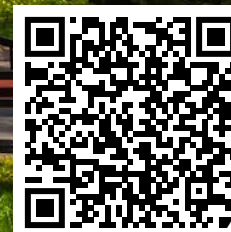
Photo: Park in Minsk, Belarus