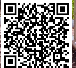
Photo: Ljouwert, Netherlands