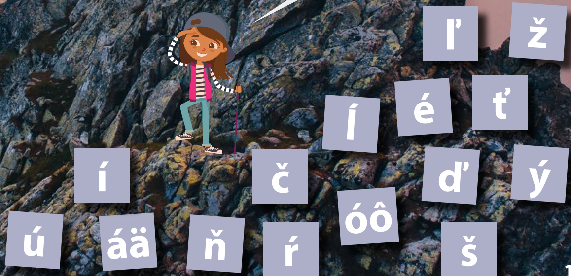
Photo: High Tatras, Slovak Republic