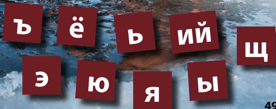
Photo: Swimming in an ice hole, Russia