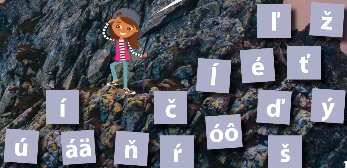
Photo: High Tatras, Slovak Republic