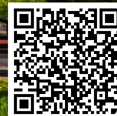
Photo: Park in Minsk, Belarus